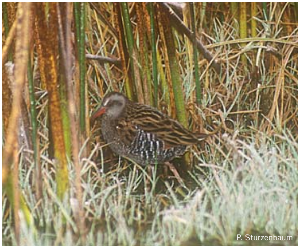
Una de las pocas imágenes recientes de este rárido, que volvió a ser observado en varias localidades

PHILIPPI, R. A. 1902. Figuras y descripciones de aves chilenas . Anales del Museo Nacional de Chile. Santiago de Chile, 114 páginas. Dibujo: R. A. Philippi